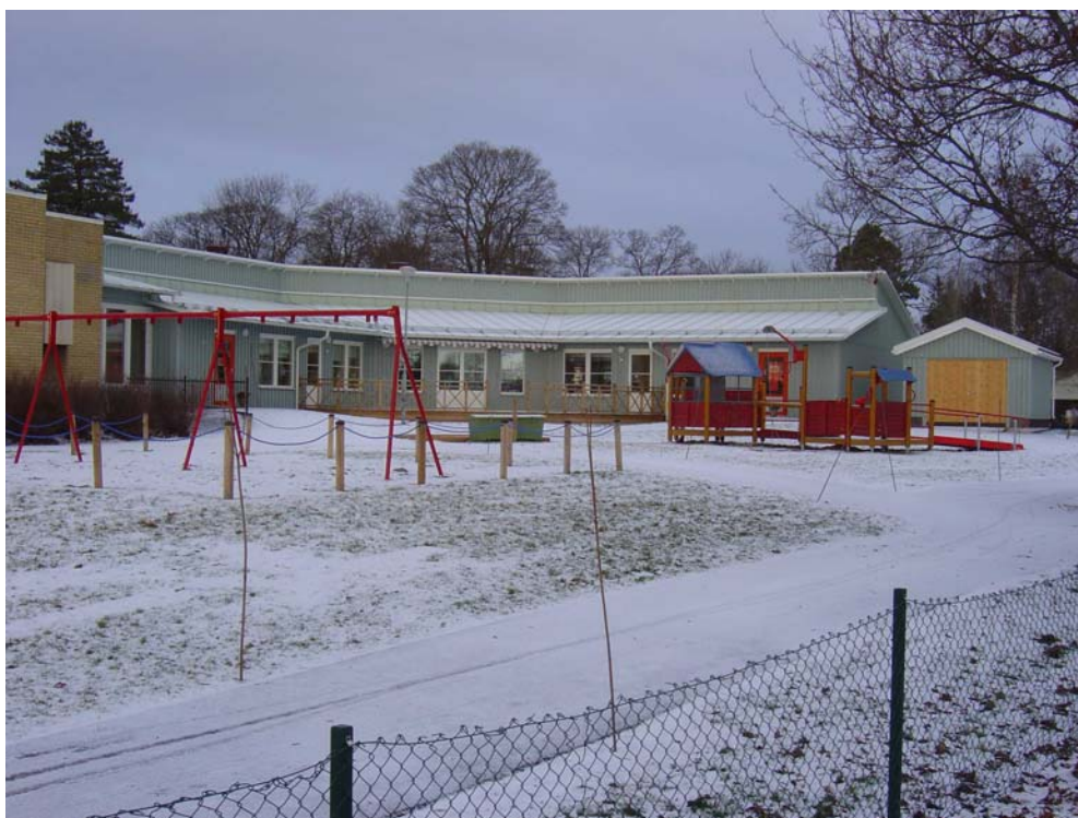
Nybyggnad vid Solbergaskolan, hösten 2007

Antagen av Hofors Kommunfullmäktige i november 2007